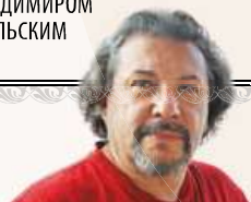
АЛЕКСЕЙ ПИЩУЛИН ■ ГЛАВНЫЙ РЕДАКТОР

Остров-град Свияжск. Гравюра по рисунку М. И. Ма- хаева. 1760-е гг.